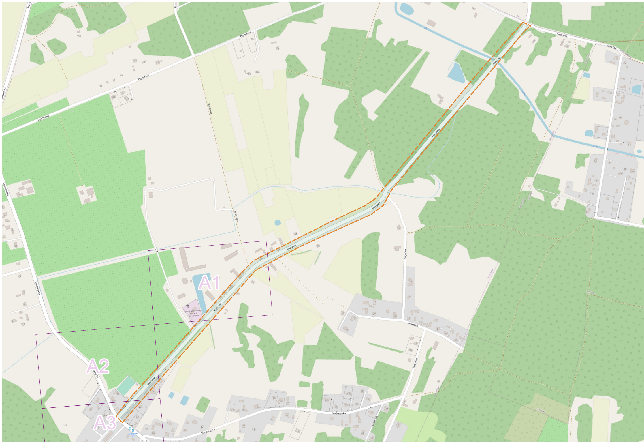
Mapa obszaru wydanych warunków technicznych